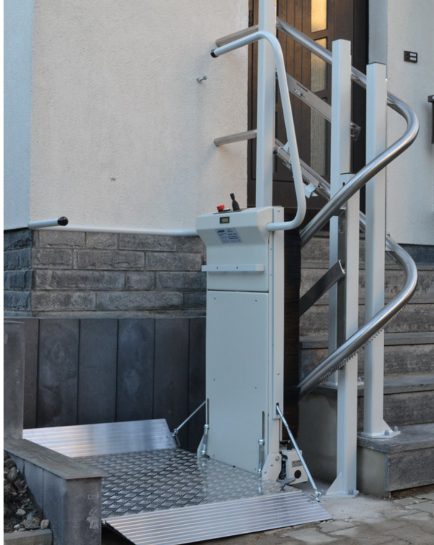
Kompaktes Design erlaubt Montage in engen Treppnhäusern

Vollautomatische Plattformfunktionen und ergonomische Befehlsgeber erlauben eine einfache und komfortable Bedienung.