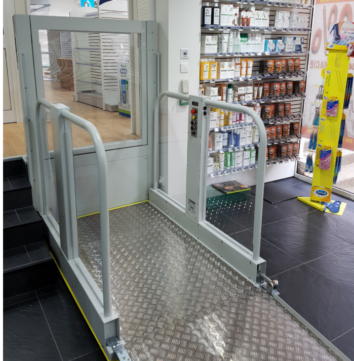
Anlage lieferbar in jeder beliebigen RAL Farbe (Standardfarbe RAL 7035)