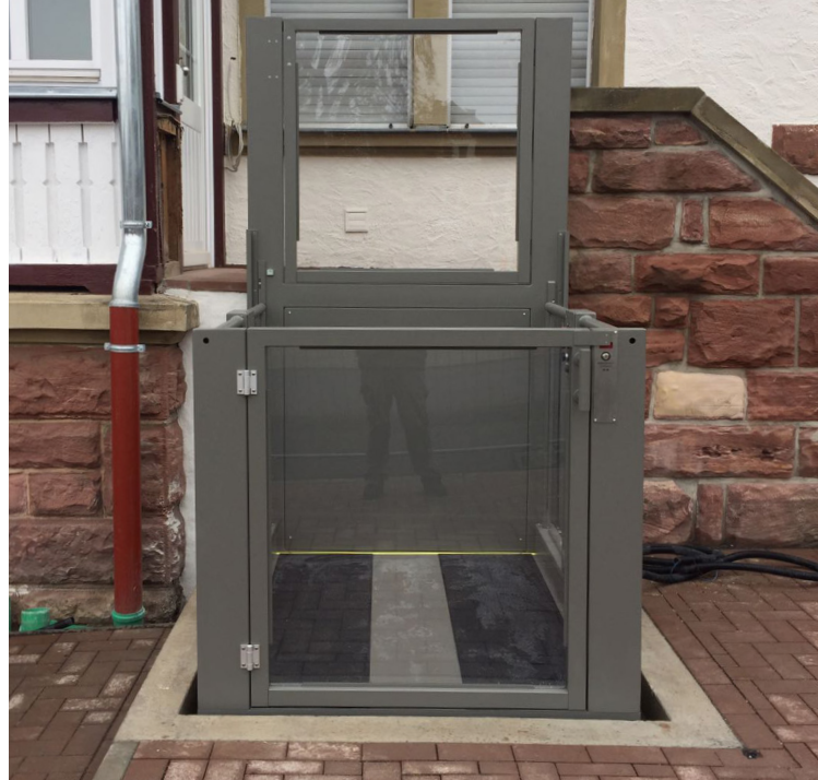
Installation in einer Grube mit Tür auf der Plattform