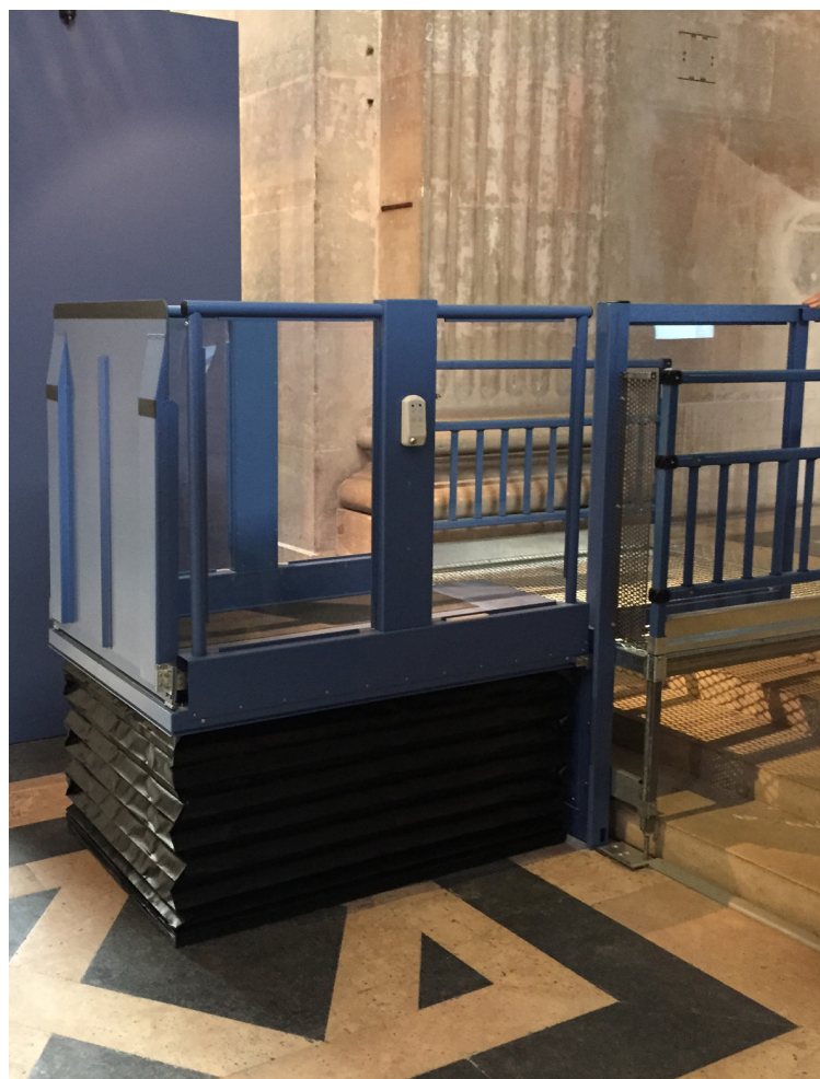
Auffahrrampe schliesst auf 1,1m Höhe über der Plattform formschön mit dem Geländer ab