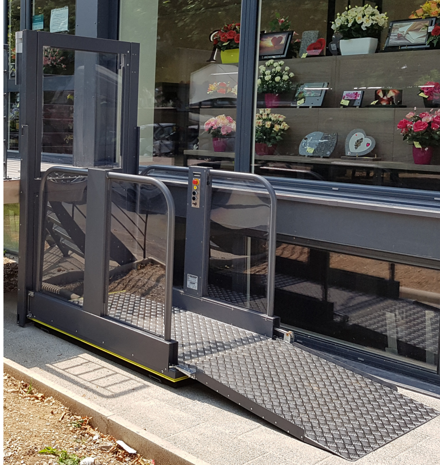
Einfache Auffahrt durch lange Auffahrrampe und geringe Plattformhöhe

Konzipiert für den Innen-, wie den Außenbereich, sorgt ein doppelter elektrischer Scherenhub und eine robuste Elektronik für einen wartungsarmen Betrieb.