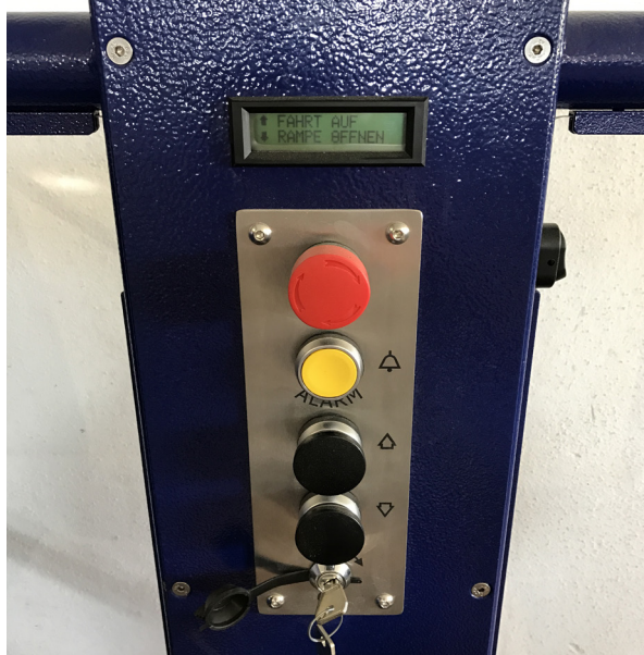
Steuerung auf Plattform mit Stop und Alarm Taster sowie Display für Status- und Fehleranzeige