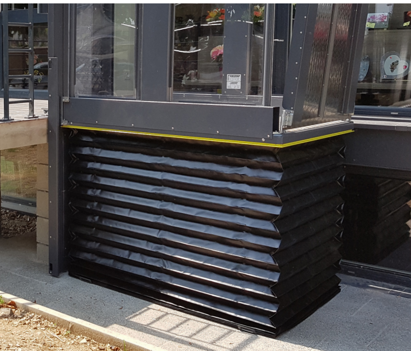
Faltenbalg und Kontaktleiste an allen 4 Seiten sorgen für höchste Sicherheit

Türen können manuel oder automatisch öffnen