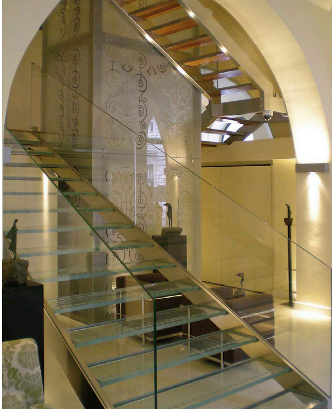
Duca d'Aosta - Hotel - 2013